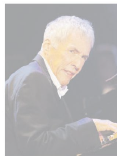
LEGGENDA Burt Bacharach